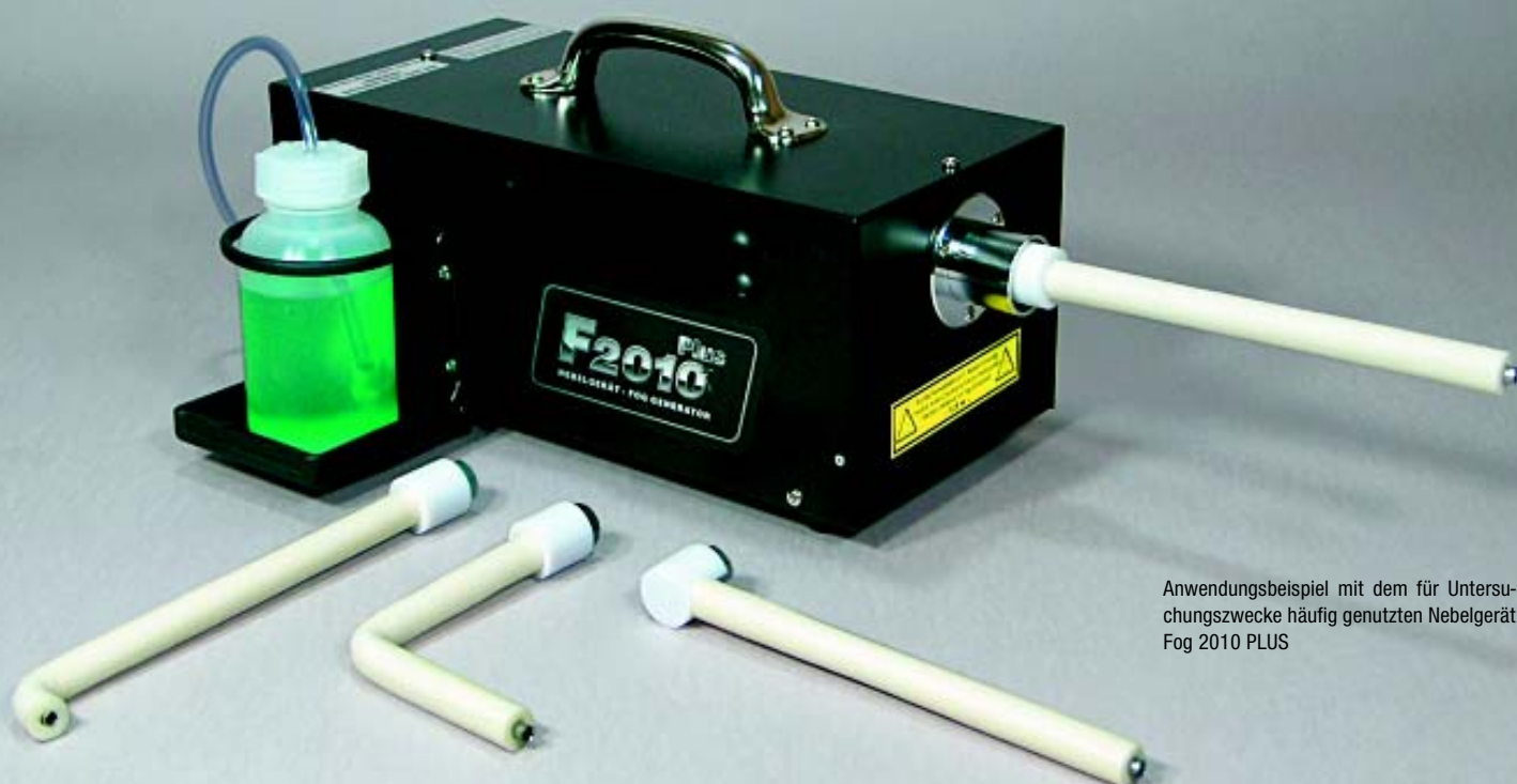
Anwendungsbeispiel mit dem für Untersuchungszwecke häufig genutzten Nebelgerät Fog 2010 PLUS

Ein erfolgreiches SAFEX®-Konzept ist die Ausstattung der aktuellen SAFEX® Nebelgeräte-Modelle mit beheiztem Düsengewinde.